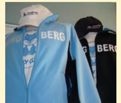
Sportartikel im Ringberg-Chic

Die hoteleigene Tourist Information hat sich in ihrem fast dreijährigen Bestehen zu einem Gästemagneten entwickelt. Gleich neben der Rezeption kann sozusagen alles Mögliche gefragt, gebucht und gekauft werden. Täglich (außer samstags) von 9 bis 13 Uhr gibt es nicht nur Prospekte, Ansichtskarten, Souvenirs, Sportartikel, 400 Bücher zum Ausleihen, Tickets, sondern auch Tipps für Ausflüge oder Veranstaltungen.