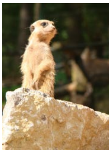
Ein Erdmännchen im Suhler Tierpark auf Wacht – Nachwuchs ist auch schon da.

Der Suhler Tierpark hat seit vergangener Herbst putzige Mitbewohner. Die quirligen Erdmännchen brauchen nicht lange, um Publikumsbeliebte zu werden. In ihrem neu errichteten Gehege fühlen sich die flinken, geselligen Tiere, die eigentlich in Wüstenlandschaften wie der Kalahari zu Hause sind, pudelwohl. Ermöglicht wurde der Bau der modernen Anlage sowie die Übersiedlung der fünf Erdmännchen aus einem anderen Zoo durch Spendenaktionen von Freunden des Suhler Tierparks. Dazu gehören auch sehr viele Hotelgäste. Denn die Geschäftsführung des Hauses ließ sich manche Aktion einfallen, um bei Veranstaltungen die Sammelbüchse zu füllen. Mehr als 1 000 Euro kamen im Laufe eines Jahres auf dem Ringberg zusammen und konnten dem Tierpark für die Erdmännchen-Anlage zur Verfügung gestellt werden. Damit ist der Suhler Tierpark um eine weitere Attraktion reicher. Neben dem Streichelzoo und der begehbaren Lori-Anlage, in der kleine Papageien zu Hause sind, sorgen nun auch die Erdmännchen für ganz besondere Erlebnisse mit Tieren.