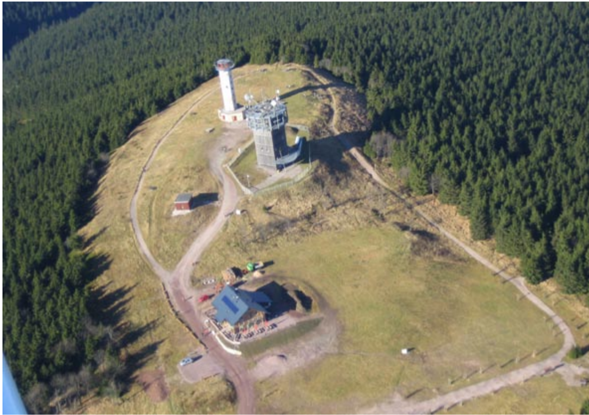
Blick aus dem Segelflugzeug auf den Schneekopf mit Aussichts- und Kletterturm, Funkturm sowie Bergbaude.

Doch beiden Bergen ist noch etwas gemein. Sie befinden sich in unmittelbarer Nachbarschaft zu Naturreservaten. Um diese geht es in einem Diskussionsprozess, der unmittelbar nach der Landtagswahl 2009 in Thüringen in Gang kam. Ganz am Anfang planten Regierungsmitglieder noch die Schaffung eines Nationalparks im Süden des Thüringer Waldes. Diese Idee fand allerdings kaum Unterstützer, sondern es organisierte sich breiter Widerstand. Diese Bürger- und Kommunalpolitikerfront lehnte großflächige Kernzonen ab, in denen jegliche Nutzung untersagt ist, weil sie ausschließlich dem Erhalt der genetischen Ressourcen und gefährdeten Arten und Lebensräume dienen, Referenzobjekte für die Forschung sind. Die Protestler plädierten für einen gesunden, artenreichen und nutzbaren Wald. Über den Nationalpark wird längst nicht mehr geredet, dafür steht nun die Erweiterung des Biosphärenreservates Vessertal im Fokus. Denn dessen Unesco-Status ist in Gefahr, so sagt es die Landesregierung. Um diesen zu erhalten, sei es nötig,