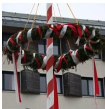
Der Maibaum ist Tradition auf dem Ringberg.

Mehr unter: www.ringberghotel.de oder www.suhl.eu